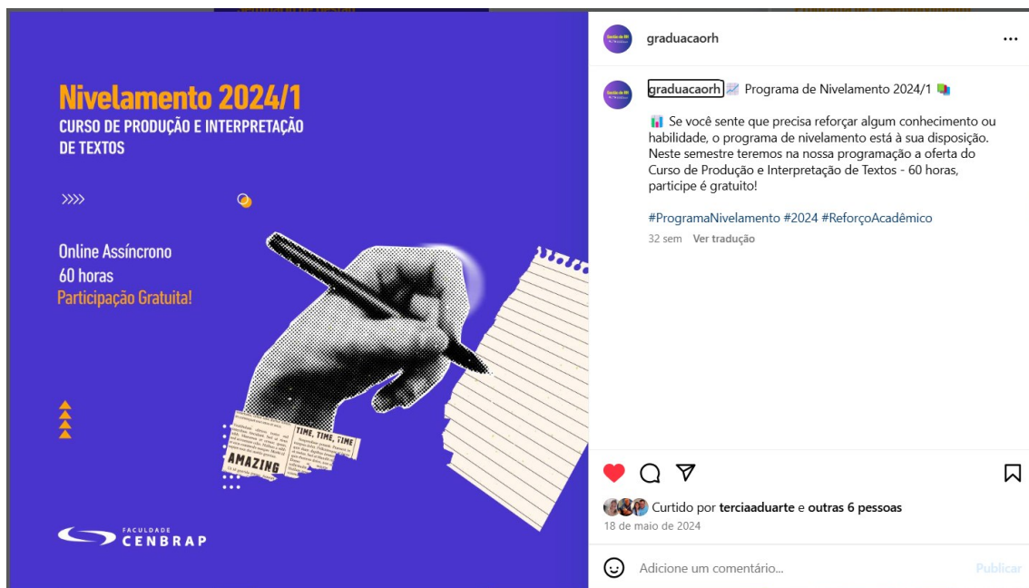
Figura 3: Divulgação das atividades de Nivelamento nas Redes Sociais